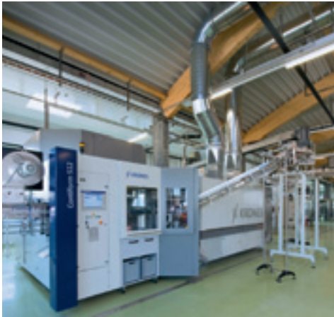
Blasen von 20 000 PET-Flaschen 0,5 Liter/h oder 10 000 PET-Flaschen 1,5 Liter.