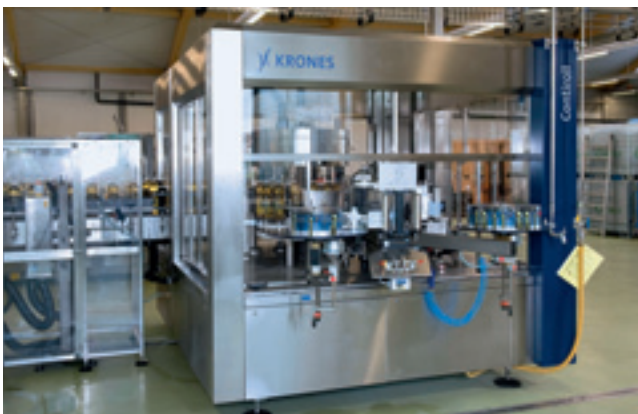
Etikettiermaschine für Rundum-Folien.

Wie bei der Glas-Linie wurde der Auftrag an die Firma KRONES Neutraubling vergeben. Sämtliche Maschinen – vom Aufblasen der Flaschen bis zur Paletten-Etikettierung – wurden von KRONES geliefert und montiert. Nach vielen Jahrzehnten Zusammenarbeit besteht ein sehr gutes Vertrauens-Verhältnis auch zur Schweizer Geschäftsstelle in Buttwil.