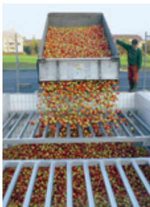
Obst-Abladen in Schwemm-Silos.