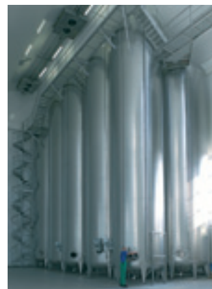
Neues Tank-Lager mit Platz-Reserve für weitere Tanks.