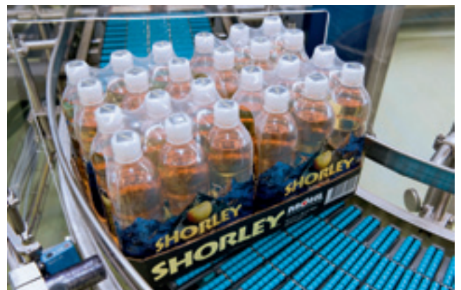
Herstellen von 6er und 24er Packs.