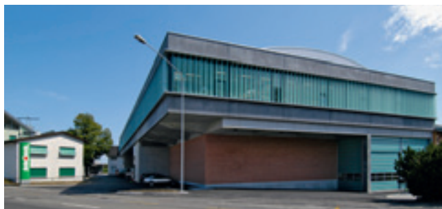
Rechts der moderne Neubau, links das Bürogebäude.

Um an eine neue Füllanlage überhaupt denken zu können, mussten im Jahre 2005 neue Apfel-Silos und ein Tanklager mit einer möglichen Lagerkapazität von 19 Mio. Liter Saft (in Form von Konzentrat) auf die grüne Wiese gebaut werden. So wurden die alten Gebäude aus den 40er und 60er Jahren zum Abbruch frei.